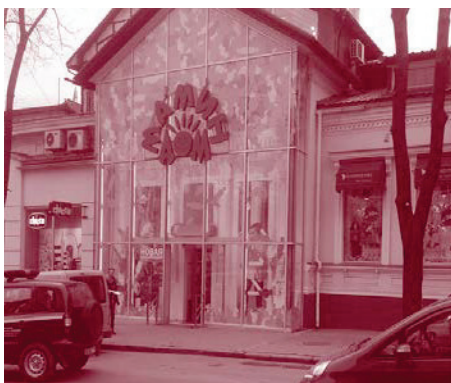
Компанія «Айліс» трансформувала мережу мультибрендового роздробу у мережу дитячих центрів «3 в 1» під брендом «Мамин Дім».

Проект тривав протягом 5,5 місяців і складався з двох етапів. На першому – консультанти проаналізували всі напрямки діяльності компанії, та разом з ключовими менеджерами сформували загальний напрямок розвитку та команду для масштабування і